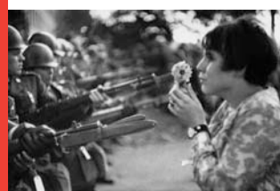
Marc Riboud, exposition Extrêmes