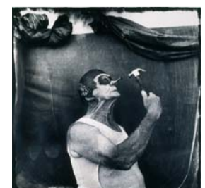
Joël-Peter Witkin, exposition Extrêmes