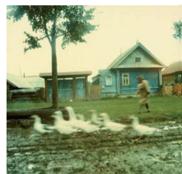
Sergel Tchilikov, exposition La photographie russe contemporaine