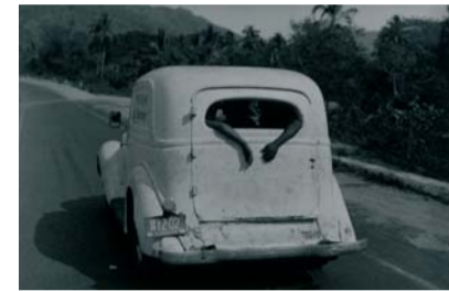
Bernard Plossu, exposition On the road