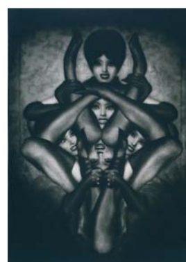
Pierre Molinier, exposition Extrêmes