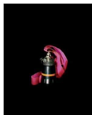
Raphaël Delpierre, exposition Extrêmes