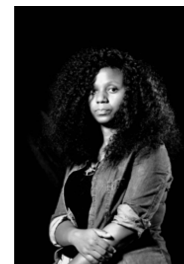
Pamela Tulizo