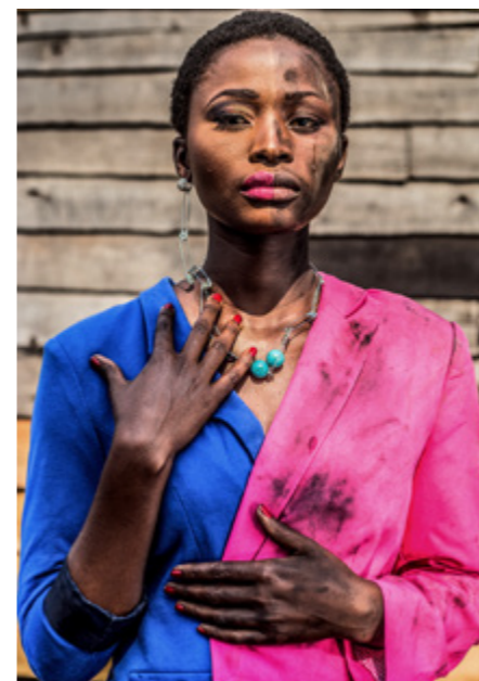
PT1 Pamela Tulizo Double identité (Femmes de Kivu) , 2019.

Les images presse sont libres de droits pour la promotion de l'exposition à la MEP. Elles ne peuvent être recadrées, modifiées ou contenir du texte.