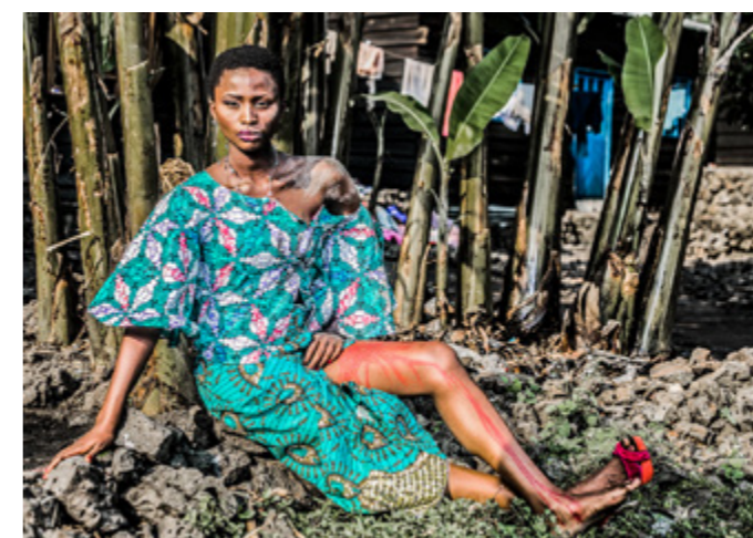
PT2 Pamela Tulizo Double identité (Femmes de Kivu) , 2019.