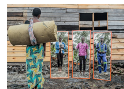
PT4 Pamela Tulizo Double identité (Femmes de Kivu) , 2019.